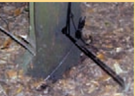
▲ Llaç col·locat per un furtiu

El furtivisme: És una amenaça constant que augmenta en la mesura que creixen les zones de seguretat. Els caçadors intenten posar tots els mitjans al seu abast per evitar-los.